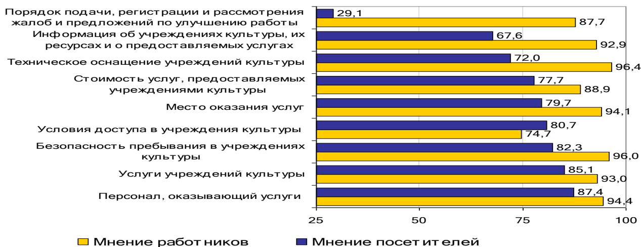
Рис. Оценка уровня качества предоставления услуг организациями сферы культуры по мнению работников и посетителей

2. Разработайте план мероприятий повышения уровня качества предоставления услуг (не менее пяти мероприятий по каждому критерию оценки уровня качества предоставления услуг организациями сферы культуры)